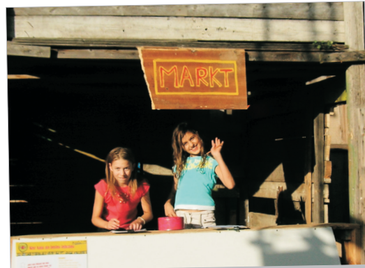
Wer schafft es, am Marktstand ein Bonbon zu kriegen?