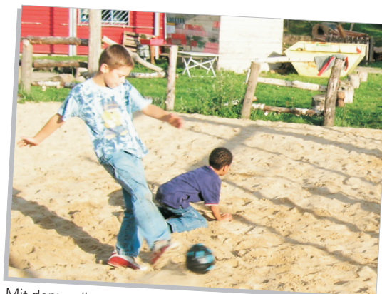
Mit dem selbst gebastelten Fussball, ein Tor zu schießen, ist gar nicht so leicht...